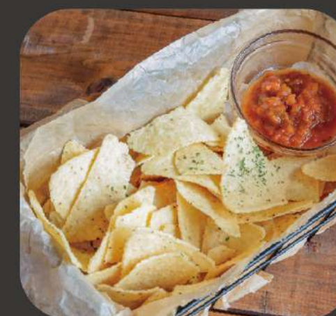
トルティーヤチップス Tortilla chips ¥550