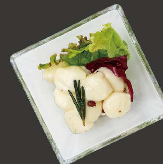
モッツァレラチーズオイル漬け Oil Pickled Fresh Mozzarella ¥800