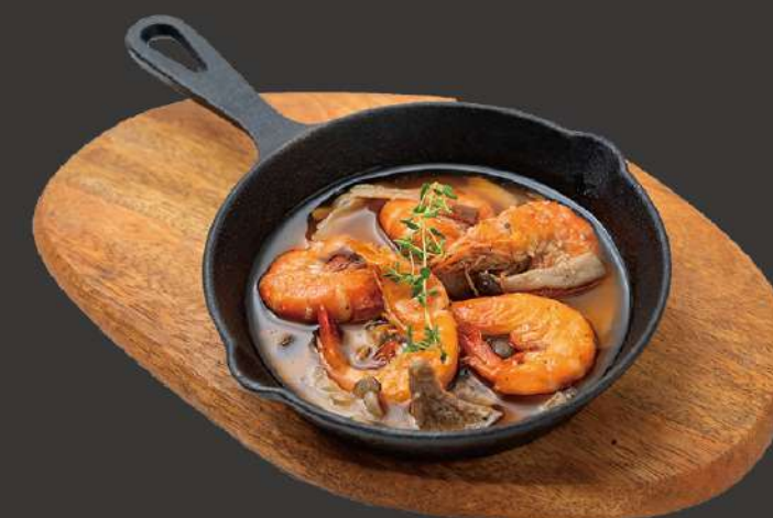
エビのアヒージョ Shrimp in Garlic Sauce ¥1,000