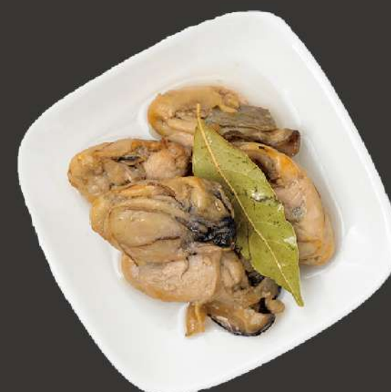
牡蠣のオイル漬け oyster-oil soak ¥1,200