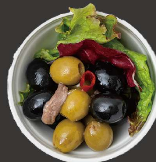
アンチョビオリーブ Anchovy olive ¥600